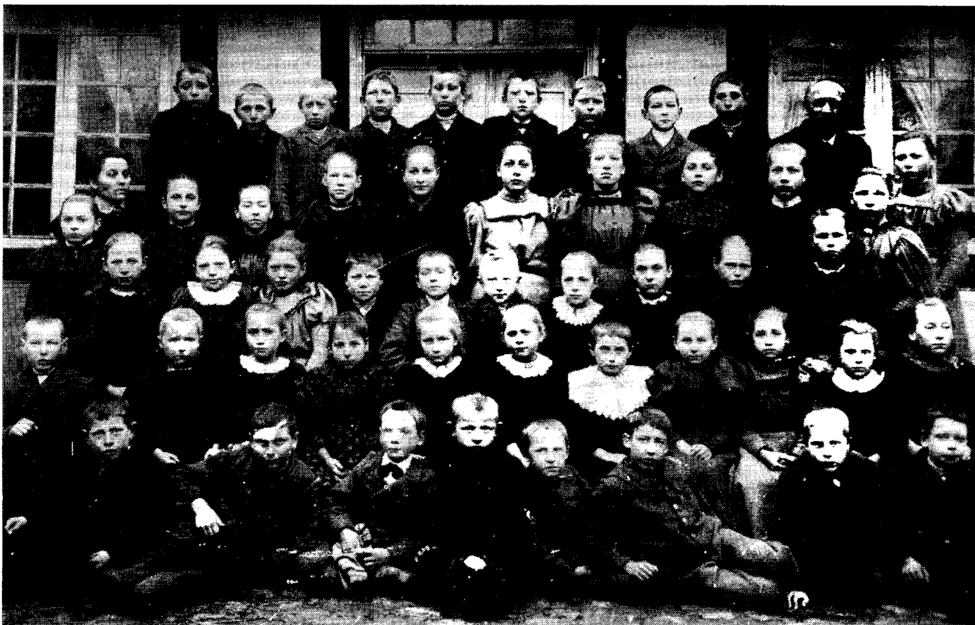
og her foran den nye skolebygning i 1904