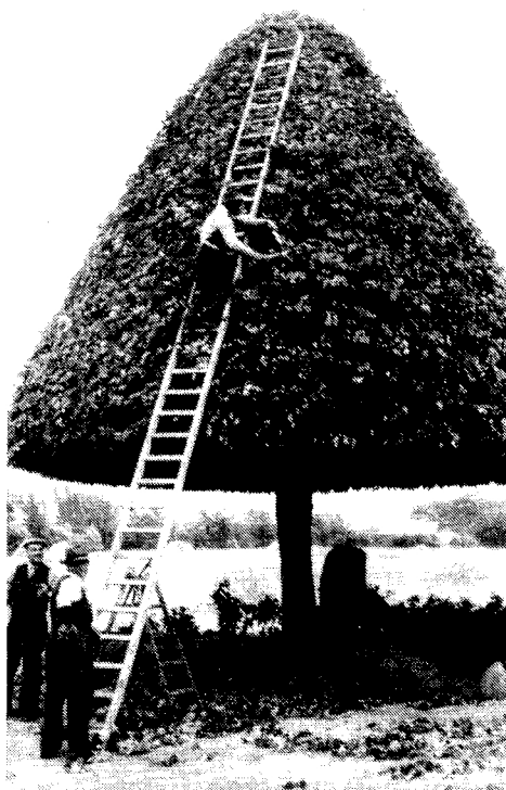
Den årlige træklipping