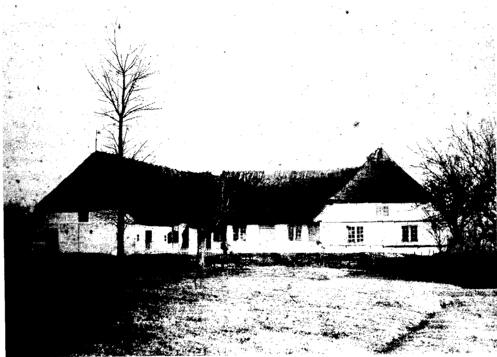
Ellinge skole før 1901

I 1846 udtalte skoledirektionen, at der ved Skellerup og Ellinge skoler burde