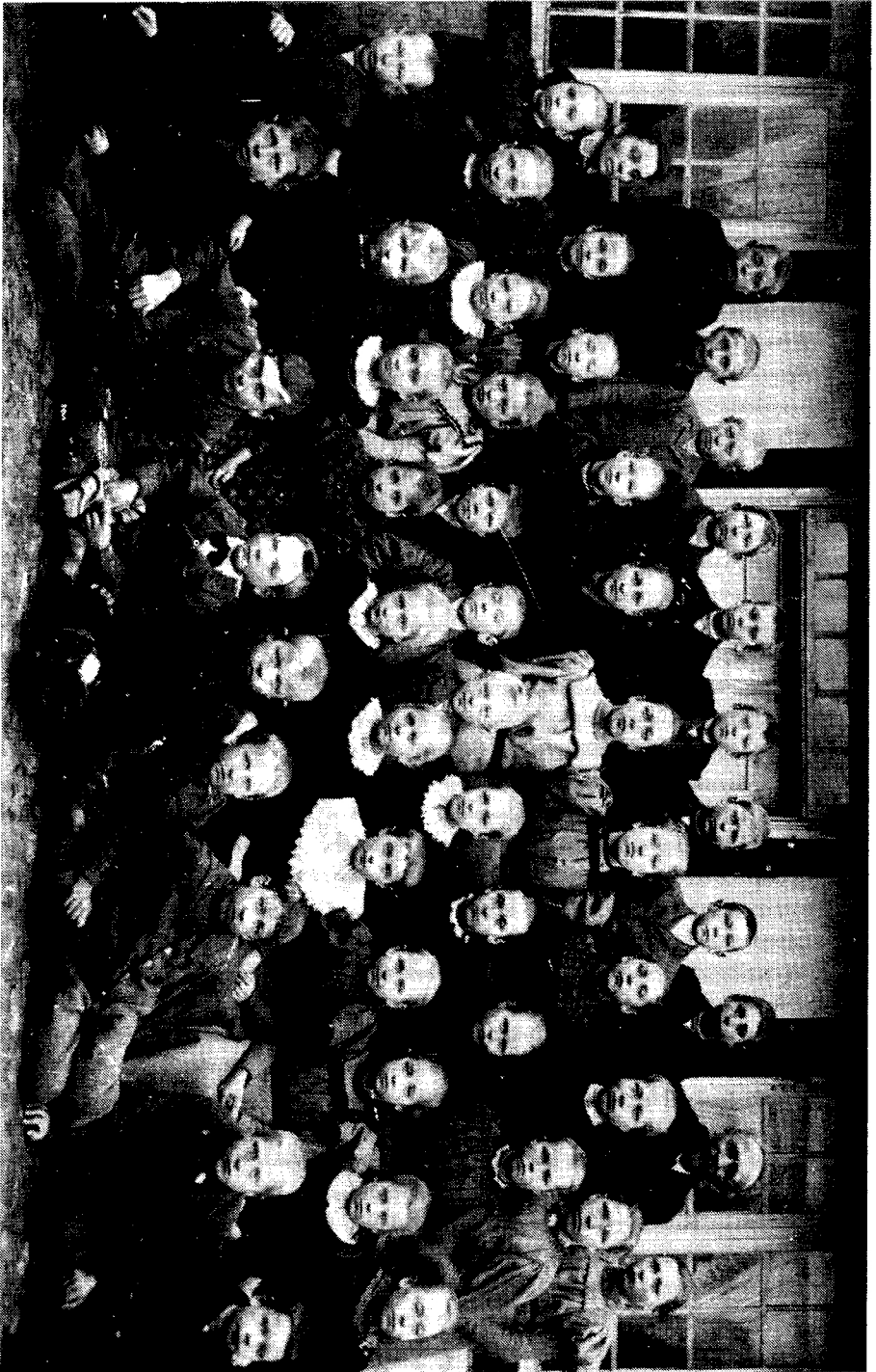
og her foran den nye skolebygning i 1904