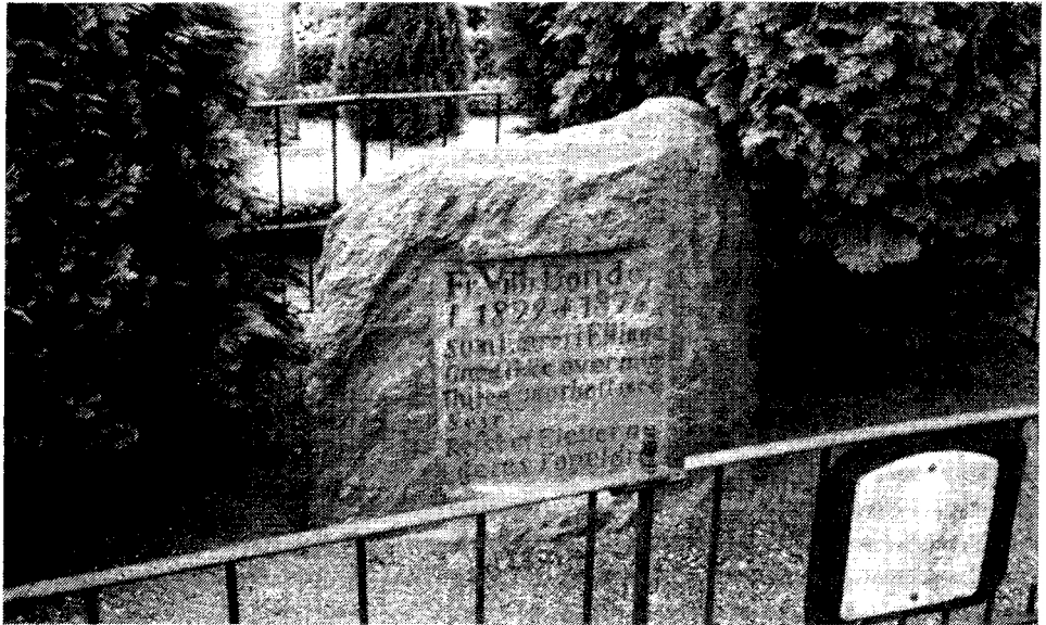
Skolelærer Bondes grav

indføres badning under lærerens opsig. Skoleforstanderskabet bemærkede hertil, at vel var der en å ved hvert af sognene, men de til badning tjenlige steder lå tæt ved alfarvej, hvor velanstændigheden ikke tillod, at badning foretoges.